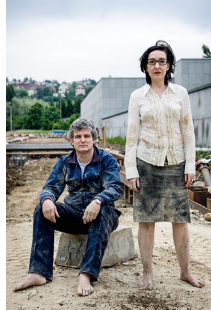
RELAX (chiarenza & hauser & co) die Künstlerinnen kurz vor dem Höhepunkt ihrer Karriere (the artists just before the peak of their career) , 2008, Fotografie, Pigmentdruck auf Fotopapier, 188 × 125 cm, Kunstmuseum Liechtenstein, Vaduz, © RELAX (chiarenza & hauser & co)

Worin unterscheidet sich Kunst von Design, Dekoration und Ornament? Es ist ihr reflexives Moment. Während zum Beispiel Hotel-Malerei, ästhetisch überbordend sich selbst feiert, trägt Kunst das Mal der Differenz, eine Öffnung, ein Noch-Nicht-Sein, die Erinnerung an ein uneingelöstes Versprechen. Trifft diese auch auf Arbeiten von Künstler*innen zu, die das Performative, Partizipative, und Populärkulturelle aufrufen, um es im Kunstkontext wirkmächtig werden zu lassen? Diese Frage habe ich mir, seit ich das französisch-schweizerische Künstler*innenkollektiv RELAX (chiarenza & hauser & co) verfolgte, wiederholt